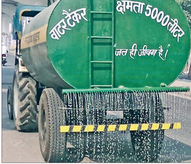
बहादुरगढ़। शहर की सड़कों पर नप द्वारा करवाया जा रहा पानी का छिड़काव।

बहादुरगढ़ में वायु गुणवत्ता सूचकांक की बात करें तो वीरवार को 466, शुक्रवार को 388 और शनिवार को 300 एक्वूआई रिकॉर्ड हुआ। लोगों को लगा कि यह राहत का क्रम जारी रहेगा, लेकिन रविवार को एयर क्वालिटी इंडेक्स 4 से पार करते हुए अति गंभीर श्रेणी में पहुंच गया। बाहर तो क्या, घरों के अंदर भी लोगों का दम घुट रहा है। सुबह से ही प्रदूषण की धुंध छाई हुई है। दृश्यता भी काफी कम है।