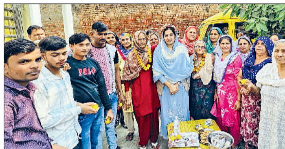
बहादुरगढ़। जाखौदा में हुए कार्यक्रम में चेरपरसन का स्वागत करते ग्रामीण।

कार्यक्रम में बड़ी संख्या में शामिल हुए प्रवासियों ने बिहार में एनडीए की जीत पर खुशी का इजहार किया। इस दौरान मनमोहित