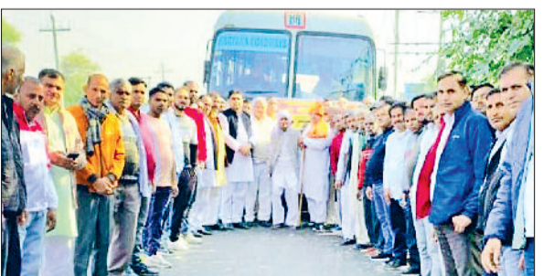
हरिभूमि न्यूज़ झंझर

डाबोदा कलां ने बहुअकबरपुर की टीम को हराया