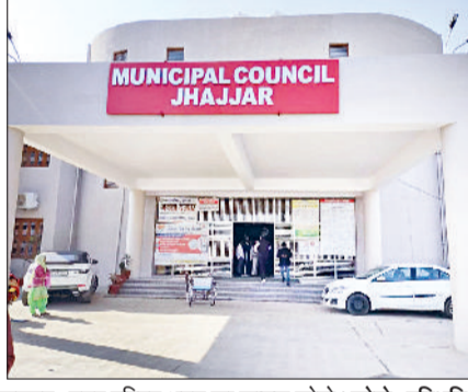
झज्जर। नगर परिषद भवन का फाइनल फोटो।