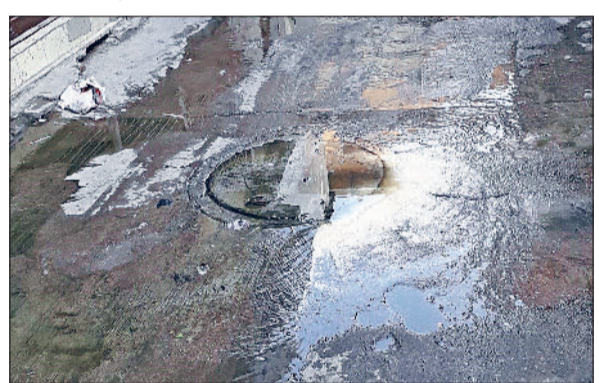
झज्जर। सीवरेज से निकलता हुआ गंदा पानी।

शहर के हरिपुरा मोहल्ला क्षेत्र में सीवरेज से निकल रहे गंदे पानी के कारण दुकानदार काफी परेशानी है। जिसके कारण दुकानदारों की दुकानदारी प्रभावित हो रही है। दुकानदारों का कहना है कि सीवरेज का मेन हाल बंद होने से गंदा बदबूदार पानी सड़क पर निकलने से राहगीरों, स्कूली बच्चों को एवं