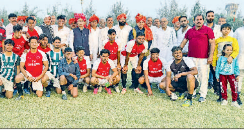
बहादुरगढ़। फुटबॉल खिलाड़ियों का उत्साह बढ़ाते विधायक राजेश जून।

डाबोदा कलां की टीम ने फाइनल में बहु अकबरपुर की टीम को 2-0 से हराकर पंचायती ग्रामीण फुटबॉल महाकुंभ जीत लिया। गांव डाबोदा कलां-मेहदीपुर में आयोजित वार्षिक खेल उत्सव में 45 टीमों ने हिस्सा लिया था। विधायक राजेश जून ने भी खिलाड़ियों का मनोबल बढ़ाया। शहीद भगत सिंह खेल परिसर में ग्रामीणों, ग्राम पंचायत, शिव शक्ति युवा संगठन और आयोजन कमेटी के सहयोग से यह आयोजन हुआ। इसमें कुल 45 टीमों में 16 को पुरस्कृत किया गया। विजेता रही डाबोदा कलां की टीम को 71 हजार रुपए का