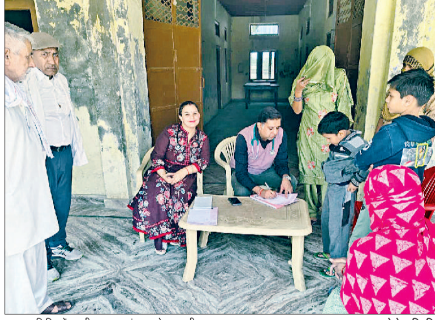
झज्जर। शिविर में अपनी स्वास्थ्य जांच कराते हुए ग्रामीण।