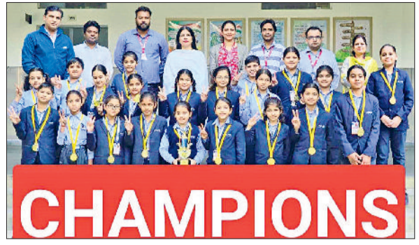
महेन्द्रगढ़। खुशी जाहिर करती हुई छात्राएं।