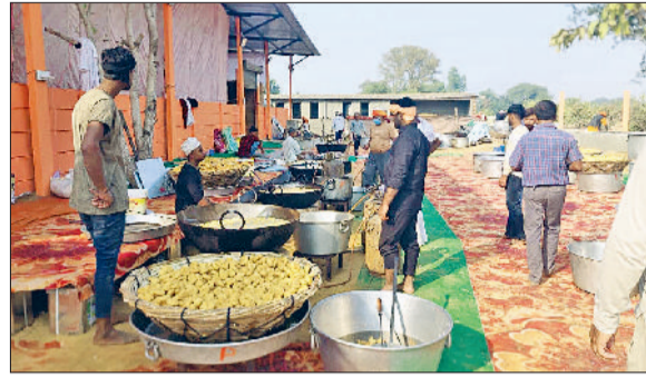
झज्जर। धूना स्थल परिसर में प्रसाद बनाने में जुटे कारीगर।