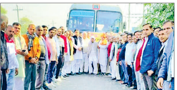
बहादुरगढ़। नारनौल के लिए रवाना होने सैनी समाज के लोग।