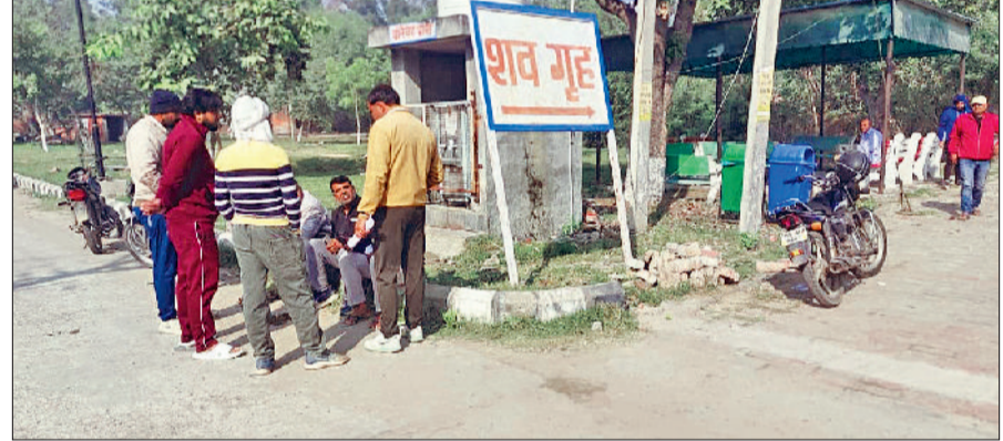
झंझर। पोस्टमार्टम के दौरान अस्पताल परिसर में उपस्थित मृतक के परिजन।

बहादुरगढ़। रोहतक-दिल्ली हाईवे पर रोहद टोल प्लाजा के निकट कबाड़ी की दुकान चलाने वाले साहिद के साथ देर रात हुई लूट और मारपीट की घटना की शिकायत थाना आसोदा में दर्ज करवाई गई है। पुलिस ने केस दर्ज कर जांच शुरू कर दी है। पीड़ित साहिद के अनुसार घटना 15 नवंबर की रात करीब 12 बजे की है। उस समय वह अपनी दुकान पर मौजूद था। तभी काले रंग की एक स्कॉर्पियो उनकी दुकान के सामने आकर रुकी। गाड़ी का नंबर अंधेरा होने के कारण वह देख नहीं पाया। स्कॉर्पियो में तीन युवक सवार थे, जिनमें से दो नीचे उतरकर उसके साथ मारपीट करने लगे। उसी दौरान बदमाशों ने उसके पास मौजूद 16 हजार रुपये छीन लिए और स्कॉर्पियो में बैठकर फरार हो गए। जाते-जाते आरोपी उसे जान से मारने की धमकी भी देकर गए। पीड़ित ने पुलिस से बदमाशों के खिलाफ सख्त कानूनी कार्रवाई की मांग की है। थाना आसोदा पुलिस ने शिकायत प्राप्त कर मामले की जांच शुरू कर दी है। पुलिस आसपास के सीसीटीवी फुटेज और हाईवे पर लगी कैमरा निगरानी के आधार पर स्कॉर्पियो तथा आरोपियों की तलाश में जुटी हुई है।